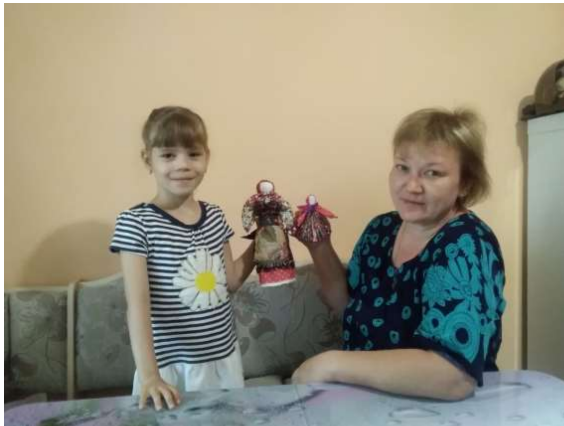
Семья Шальковых . Куклы- берегини.