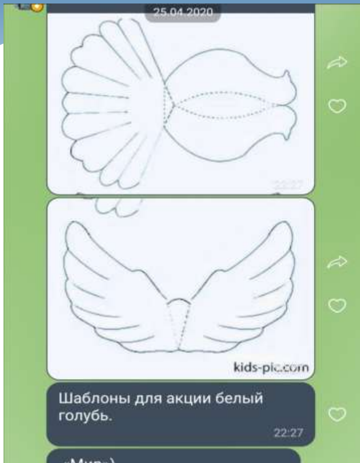
«Шаблон для акции «Белый голубь»»