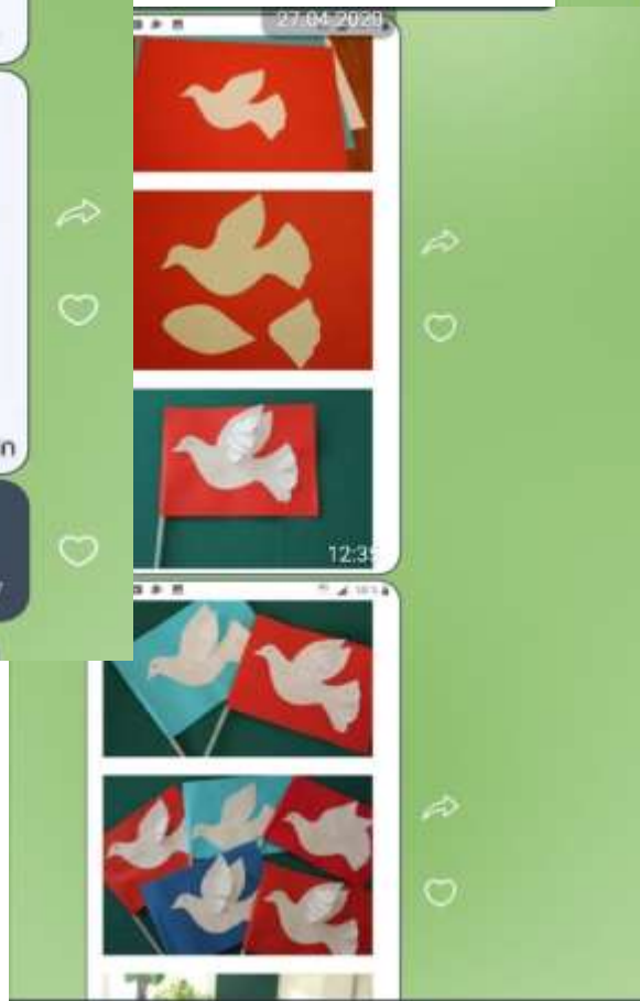
«Пример поделки «Флажок»»

Напоминаем 27.04.2020 "Голубь мира" (белыми голубями из бумаги следует украсить окно или что-то во дворе дома, сфотографировать, поделиться с нами и отправить на номер телефона в объявлении 12:26